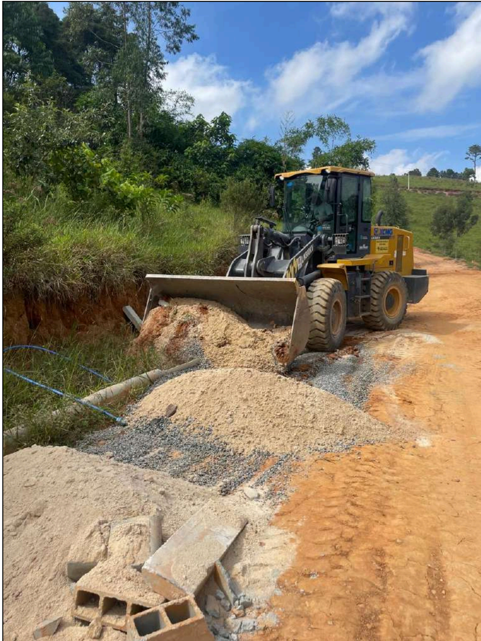
Imagens da ação do dia 19/04/2024 no município de Arujá.