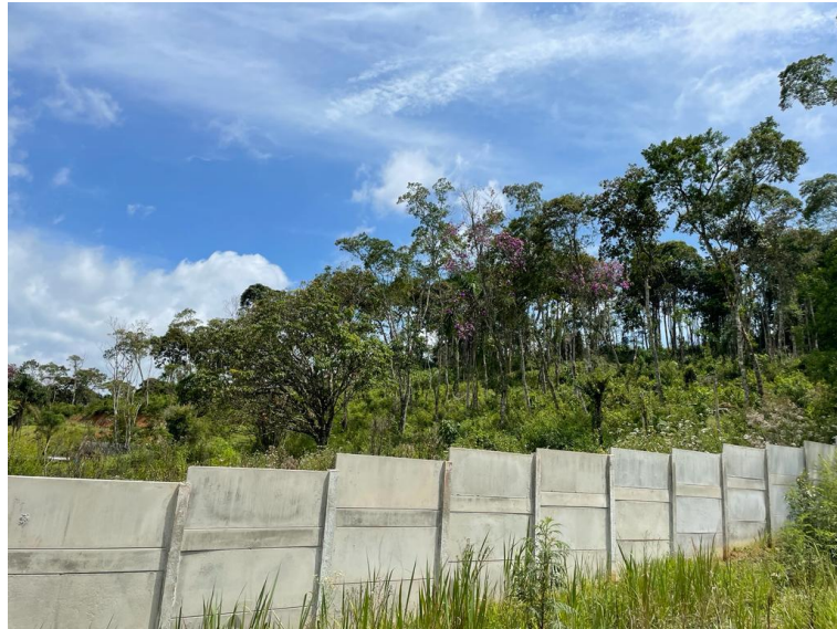
Imagens da ação do dia 24/02/2023 no município de Arujá.