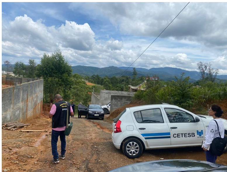
Imagens da ação do dia 03/03/2023 no município de Suzano.