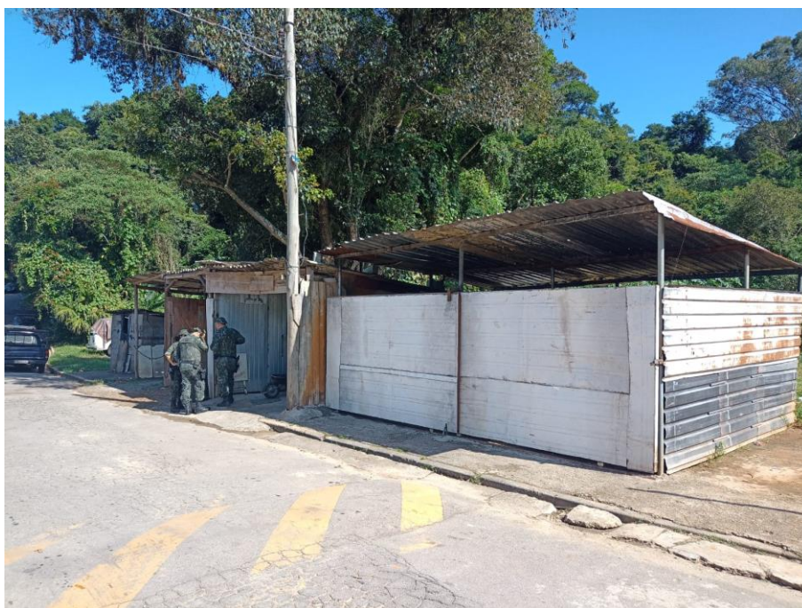
Foto 1: Operação em Caieiras. Comércio e garagem irregulares em APRM e APP.