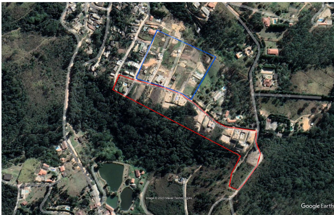
Figura 4: Área fiscalizada em Mairiporã. A soma dos polígonos corresponde a 5,3 hectares.