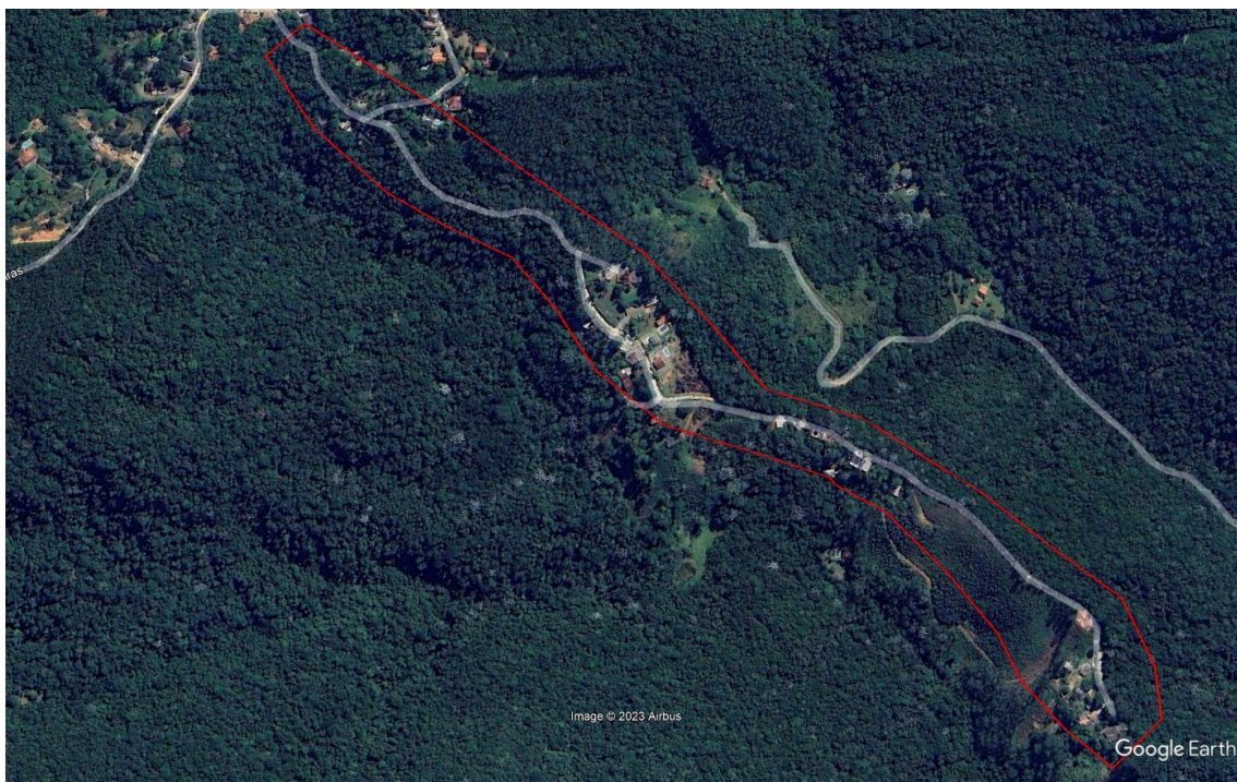
Figura 3: Área fiscalizada em Guarulhos. Polígono vermelho mede cerca de 16 hectares.