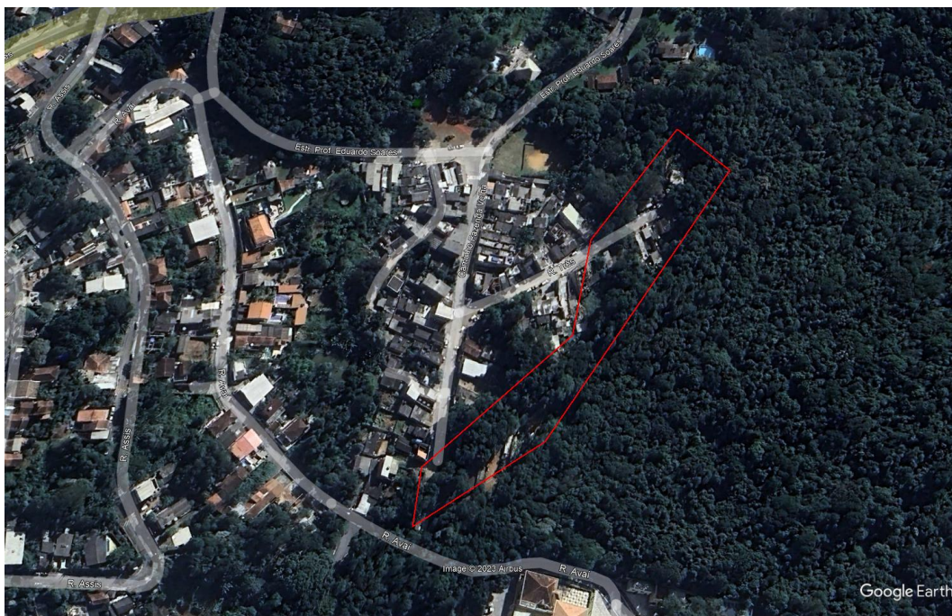
Figura 1: Área fiscalizada em Caieiras medindo aproximadamente 1 hectare (polígono vermelho).