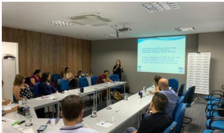
CONDEMAT - 05/02/2020