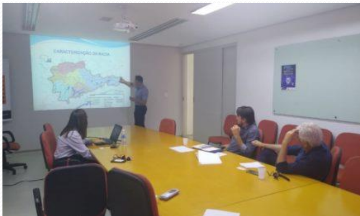
Consórcio ABC - 10/03/2020