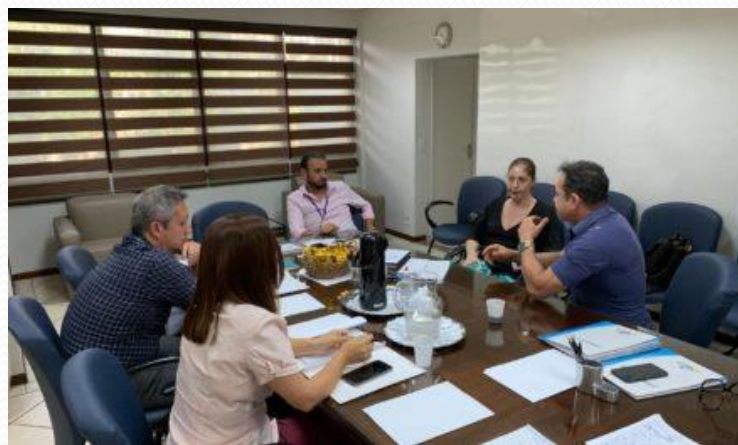
SABESP - 28/01/2020