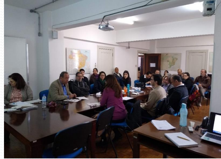
Reunião da CTGI