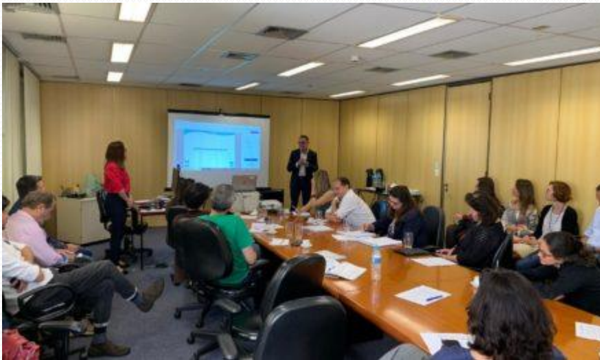
Projeto Conexão Água do Ministério Público Federal - 02/03/2020