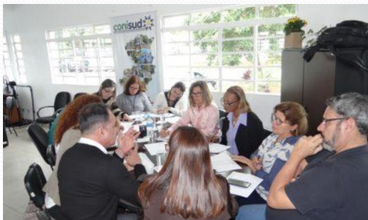
CONISUD - 02/03/2020