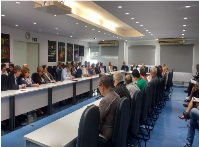
1ª Reunião Plenária da Gestão