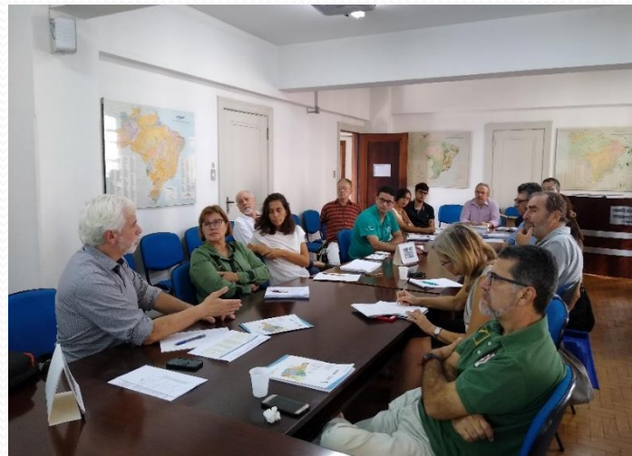
Reunião da CTPA