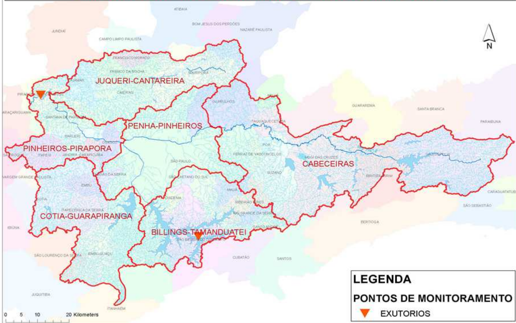
MAPA MONITORAMENTO DA BACIA HIDROGRÁFICA DO ALTO TIETÊ