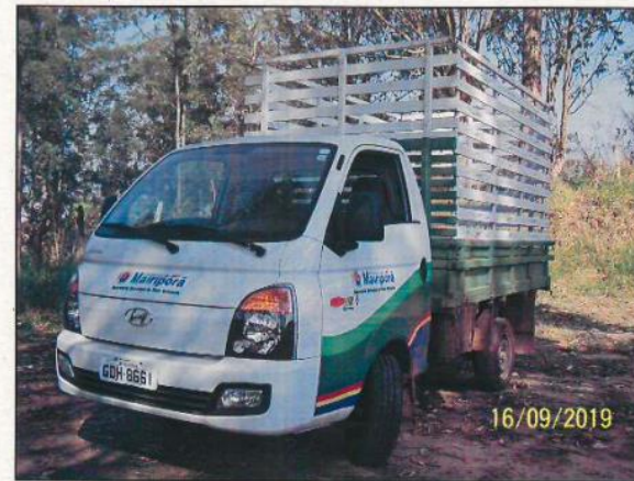
FOTO 1. CAMINHONETE