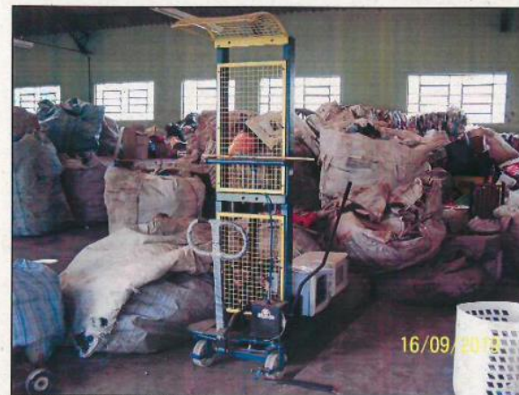
FOTO 2. ELEVADOR DE CARGAS