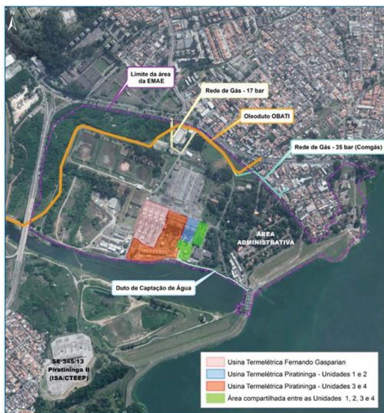
Figura 2: Mapa da propriedade da EMAE com instalações indicadas.

Destaca-se que empreendimento em licenciamento corresponde apenas à substituição tecnológica das Unidades 1 e 2 da UTE Piratininga. A linha do tempo representada na Figura 2, subsequente apresenta um breve histórico da UTE Piratininga, as quais serão substituídas pelo Blocos I e II.